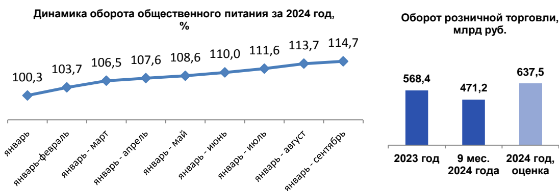
Рис. 3. Данные по обороту общественного питания и обороту розничной торговли

Стоимость минимального (условного) набора продуктов питания, фиксированного набора потребительских товаров и услуг и ИПЦ являются одними из индикаторов, характеризующих состояние потребительского рынка, уровень потребительского спроса и предложения. Для оценки состояния потребительского рынка используются данные статистики по обороту розничной торговли и общественного питания (Рис. 3).