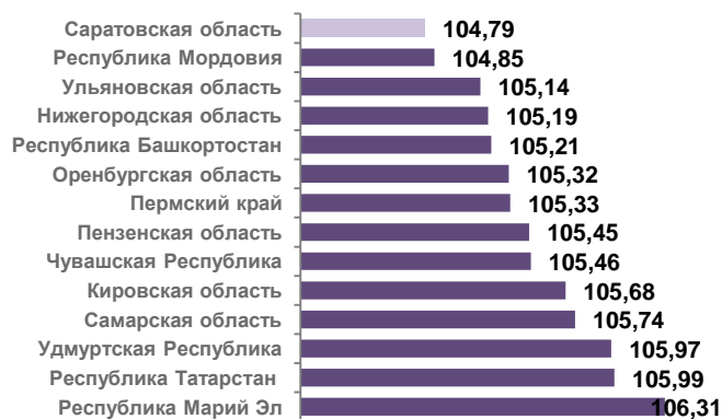
Рис. 1. Индексы потребительских цен и тарифов на товары и платные услуги населению в субъектах ПФО, (сентябрь 2024 года к декабрю 2023 года)

С начала года инфляция по области составила 4,8% (по РФ – 5,8%). По уровню инфляции в рейтинге Приволжского федерального округа (ПФО) область на 1 месте по минимальному показателю (Рис. 1). Годовой темп роста потребительских цен в области составил 8,2% (сентябрь 2024 года к сентябрю 2023 года).